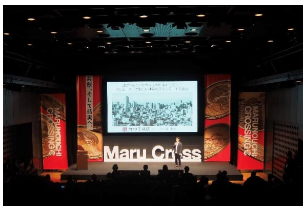
左：左から TMIP 事務局大淵、松井氏、入山氏、飯野氏、藤井氏、今井氏、河邊氏、西田氏、守屋氏、藤本氏 右：最終審査のピッチに登壇した株式会社竹中工務店 Archi-Hub 藤井康平氏