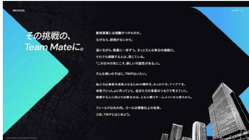
▲新スローガン「その挑戦の、Team Mate に。」

新規事業に挑戦する社会の実現を目指し、新スローガン「その挑戦の、Team Mate に。」には、新規事業に挑戦するプレイヤーが抱える「知見不足、人脈不足、スピード感不足、社内理解獲得の難しさ」に寄り添い、丸の内というフィールドでともに挑戦したいという想いを込めています。なお、TMIP は、5 周年の節目に提供サービスや会員プランのリニューアルを実施しました。